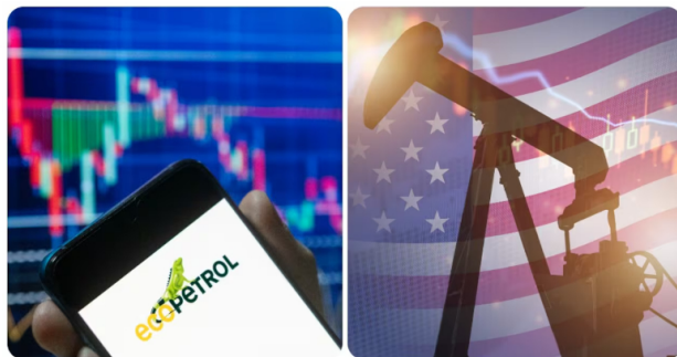
Ecopetrol desistió de aumentar su apuesta por el fracking en Estados Unidos, en una inversión de 3.600 millones de dólares que aseguraría más utilidad, más Ebitda, más producción y más reservas. Además, con mejores indicadores ambientales que las operaciones que tiene en Colombia.

De acuerdo con un informe interno de Ecopetrol, esta iniciativa conocida como Proyecto Oslo, le representaría grandes ventajas a la petrolera que ayudarían en el futuro a paliar los resultados: la producción se incrementaría 9 por ciento, las reservas también aumentarían 9 por ciento, la utilidad neta crecería 14 por ciento, el Ebitda subiría 6 por ciento y el impacto ambiental sería mucho menor en casi 8 veces, al que registran las operaciones de los pozos de producción tradicional en Colombia.