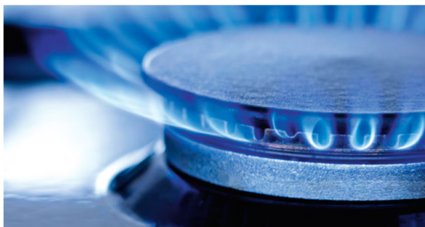
Manifestó la USO que Ecopetrol produce seis de cada diez barriles de petróleo de Colombia; el 80% del gas natural que usan 10,5 millones de usuarios

Manifestó la USO que Ecopetrol produce seis de cada diez barriles de petróleo de Colombia; el 80% del gas natural que usan 10,5 millones de usuarios ; abastece el GLP con el que cocinan 3,5 millones de hogares; y provee el gas natural que usa el 65% de las pequeñas y medianas empresas.