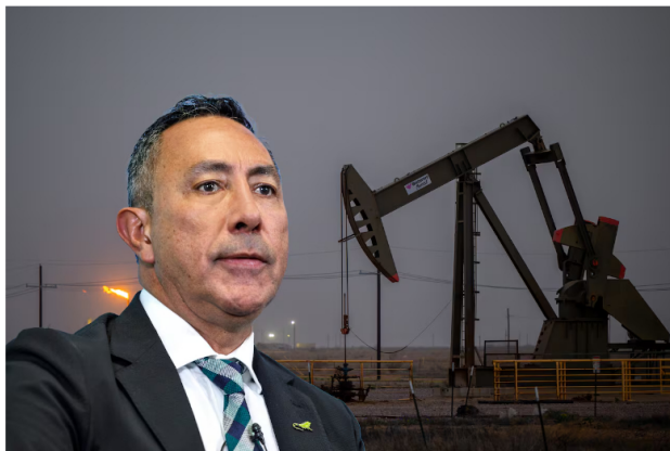
Para Ricardo Roa, presidente de Ecopetrol, las cifras del segundo trimestre de 2024 fueron impactadas por efectos como el comportamiento del dólar y de los precios internacionales del petróleo, la inflación, la reforma tributaria de 2022 y el fenómeno de El Niño.

“La tasa de cambio tuvo una variación superior a los 600 pesos en el primer semestre, esto impacta 3,3 billones de pesos los resultados”, dijo, y agregó: “Qué hay que hacer para tener los números de 2022, la respuesta es simple: que tengamos barriles de petróleo a 100 dólares y que el dólar vuelva a 4.000 pesos”.