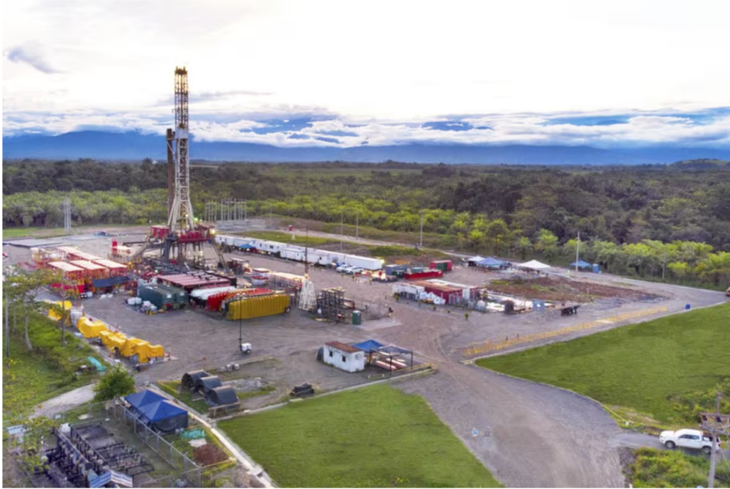
Campo de exploración petrolera en el nororiente de Colombia.

El sindicato de trabajadores de la industria del petróleo insistió en la importancia de redirigir los recursos hacia la exploración y producción en Colombia.