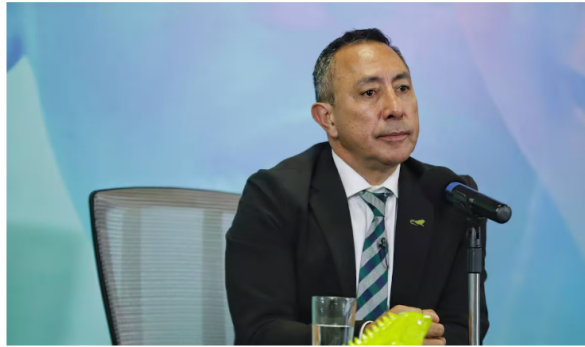
Presidente de Ecopetrol, Ricardo Roa.

La reciente decisión de Ecopetrol de no proceder con la compra de CrownRock, una transacción valorada en US$3.600 millones, ha sido vista por la USO como una oportunidad para fortalecer la exploración y producción interna en Colombia. “Es una oportunidad para reactivar la actividad de exploración dentro del país, generando nuevos puestos de trabajo y aumentando reservas”, afirmó la organización sindical, sugiriendo que los recursos liberados deberían invertirse en la búsqueda de gas natural y el desarrollo de nuevos gasoductos. Le puede interesar: Inversiones forzosas de Petro: “Un abuso con los ahorradores colombianos”, Fenalco