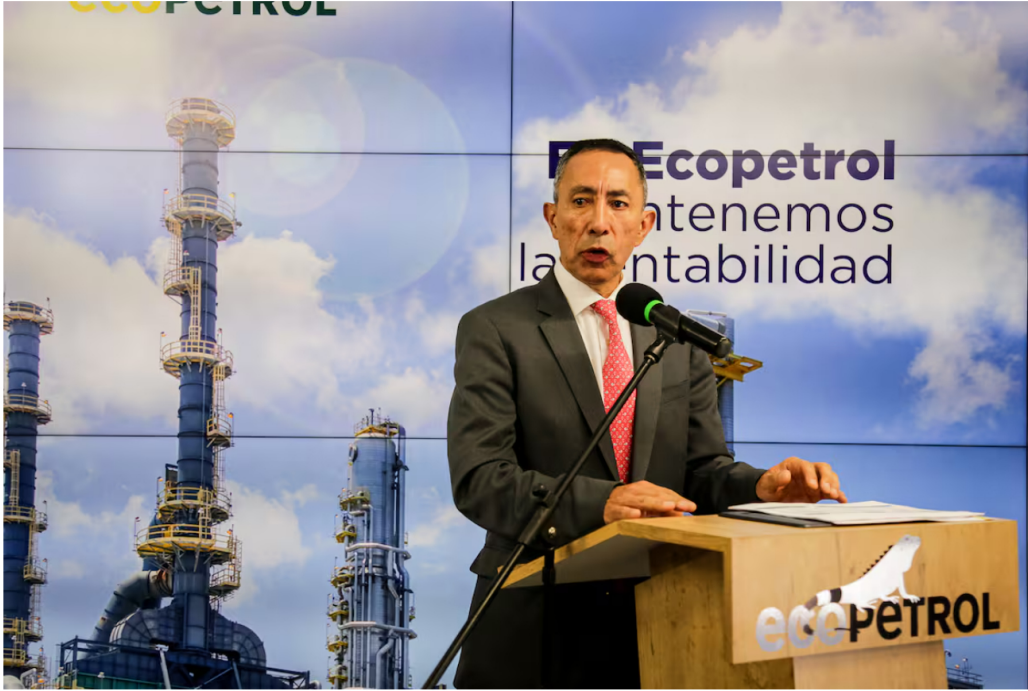
Ricardo Roa Barragán, director de Ecopetrol, hace entrega de resultados operativos y financieros correspondientes al primer trimestre del año 2024.

Así lo expresó el presidente de Ecopetrol, en medio de una entrevista en Noticias Caracol. Este es el precio que podrían aumentar.