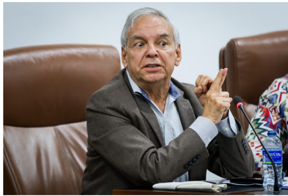
Ricardo Bonilla, ministro de Hacienda y Crédito Público.

Por su parte, el ministro de Hacienda, Ricardo Bonilla, se pronunció sobre el tema en el lanzamiento de la Revista Economía Colombiana de la Contraloría General edición 372, donde anunció que el reajuste del precio del diésel será inevitable. “Será una medida impopular que tendremos que tomar y anuncio que, sobre ese tema, no va a haber acuerdo con los transportadores”, advirtió Bonilla.