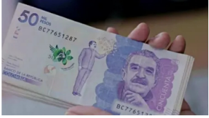
Descubre las últimas tendencias en el