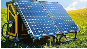
No es broma: Esto es lo que pueden costar