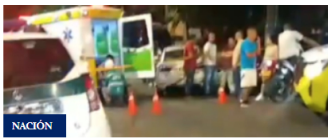
Dos muertos dejó accidente de tránsito en Santa Cruz, Medellín