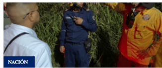
Continúa activo el incendio forestal en Cerro de las Tres Cruces, Cali