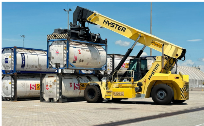
Los isotanques son contenedores fabricados bajo normas ISO para el transporte de líquidos y gases.

Por primera vez, la empresa transporta sus productos directamente desde la refinería de Barrancabermeja hasta el puerto de destino, sin intermediarios.