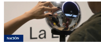
Cargos contra Worldcoin, empresa que recolecta datos a través del iris