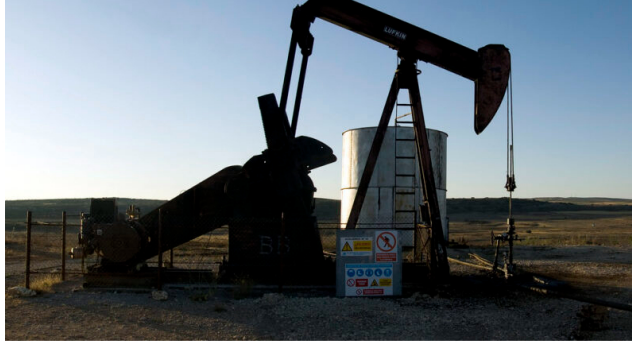
Bomba Petrolera