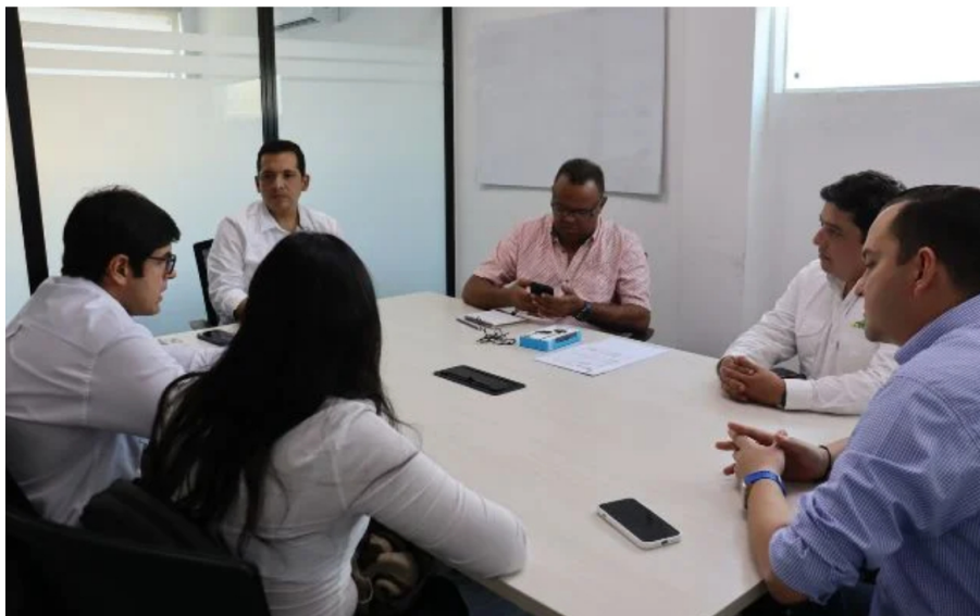
Avances en la Ampliación de Servicios de Gas Natural y Mejoramiento de Infraestructura Educativa en La Guajira

Por: Redacción Barranquilla — agosto 20, 2024