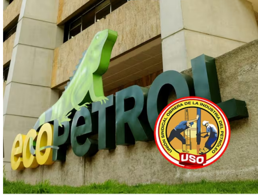
La Unión Sindical Obrera, hizo un llamado urgente al Gobierno Nacional y Ecopetrol, para reactivar la exploración de hidrocarburos en el país.

A través de un comunicado de dos páginas, la Unión Sindical Obrera insiste en que esa exploración y producción, sean utilizados los más de 3.600 millones de dólares, que se liberaron por no haber adquirido los activos de CrownRock.