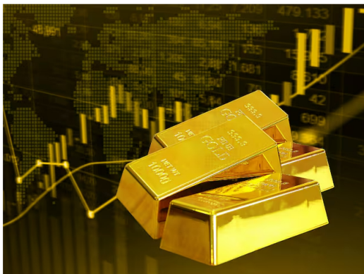
Lingotes de oro sobre fondo amarillo negro con gráficas en subida

El precio de este metal está en alza. Se espera que su valor se mantenga en estos números históricos.