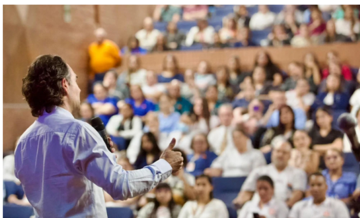
Federico Gutiérrez

Por: Geovany Quintero Gómez | 20 de Agosto, 2024 Actualizado: agosto 20, 2024 08:18 a. m.