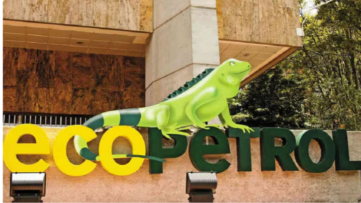
Ecopetrol anuncia nuevo sistema de exportaciones de petroquímicos hacia Latinoamérica. La compañía busca eliminar la intermediación en sus exportaciones y disminuir la huella de carbono producto de sus operaciones.

El nuevo modelo implica el transporte de estos productos por el río Magdalena desde Barrancabermeja hasta Cartagena