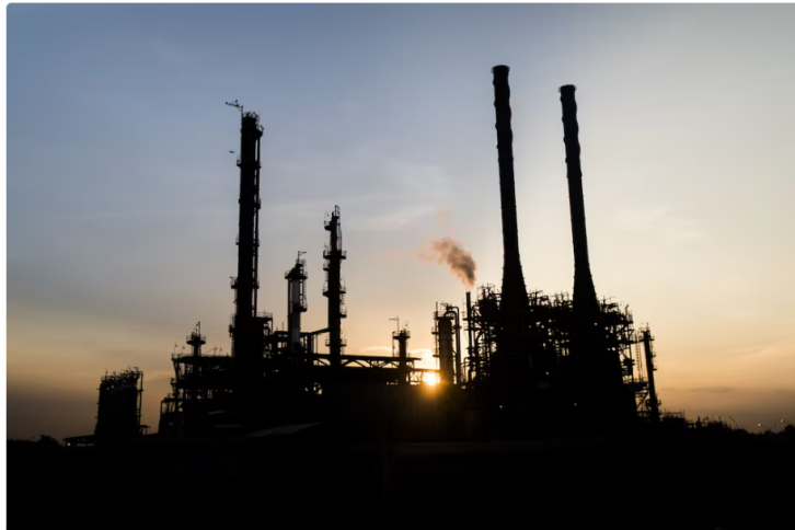
La refinería de Ecopetrol en Barrancabermeja. La refinería de Ecopetrol en Barrancabermeja

El objetivo del nuevo sistema de exportación, además de reducir la huella de carbono y disminuir los intermediarios, es llegar a países como Perú, Ecuador, Honduras y Puerto Rico, entre otros, si bien la meta es cubrir toda Latinoamérica y el Caribe, incluso mercados en Europa y Asia.