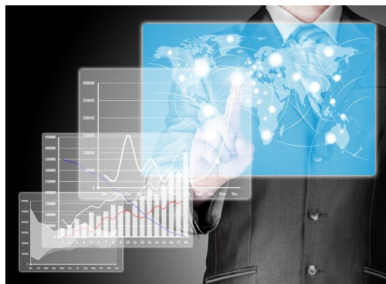
Las aplicaciones de Inteligencia Artificial son numerosas y las soluciones que ofrece son adaptables de acuerdo con las necesidades de cada empresa o del sector. En la banca sin duda, la IA ofrece mayor protección, permite mejorar servicios y productos, contribuye a hacer operaciones más eficientes, facilita la expansión de la banca y la llegada a nuevos clientes

Es una realidad que las herramientas tecnológicas han contribuido de manera importante en el avance de los procesos de bancarización. En Colombia, gracias al uso de la tecnología y el impulso logrado después de la pandemia, 6 de cada 10 colombianos cuentan hoy con al menos un producto de depósito digital, de acuerdo con informes de la Superfinanciera.