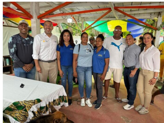
Fuente: IPSE. La interconexión también garantizará la atención a 52 hogares más de veredas aledañas del área intermedia