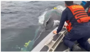
Armada colombiana y comunidad liberan ballena atrapada en malla en el Chocó