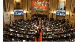
Radican en la Cámara de Representantes proyecto de ley para eliminar el 4x1000