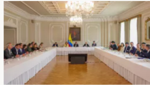
Inversión forzosa: Gobierno y banca cerrarán acuerdo la próxima semana