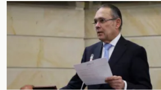
Presidente del Congreso denuncia parálisis en el Senado por falta de recursos