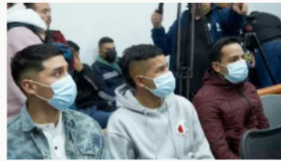
Imputados motociclistas que causaron la muerte a dos mujeres en Soacha