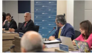
Falsos positivos: JEP cambia fecha de juicio al coronel (r) Publio Hernán Mejía