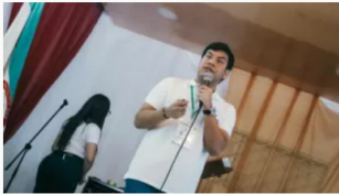
Falleció el alcalde de Aguachica, Cesar, Víctor Roqueme