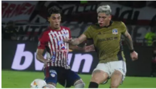
Junior eliminado de la Copa Libertadores tras caer ante Colo Colo