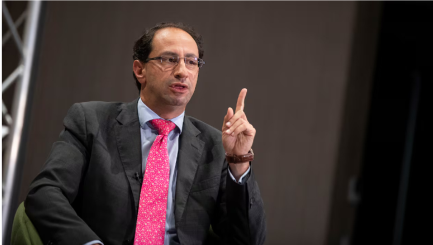
José Manuel Restrepo Ministro de Hacienda 12 de enero de 2022

primer semestre del 24 %, pero cuando yo subo esa caída de utilidad con lo que sucedió en 2023, la caída es de más del 70 % de utilidades en año y medio. Operativamente está cayendo en el primer semestre el 9 %, en generación de caja también está cayendo casi al 4 %, y las ventas caen al 5 %”, aseguró en entrevista con SEMANA.