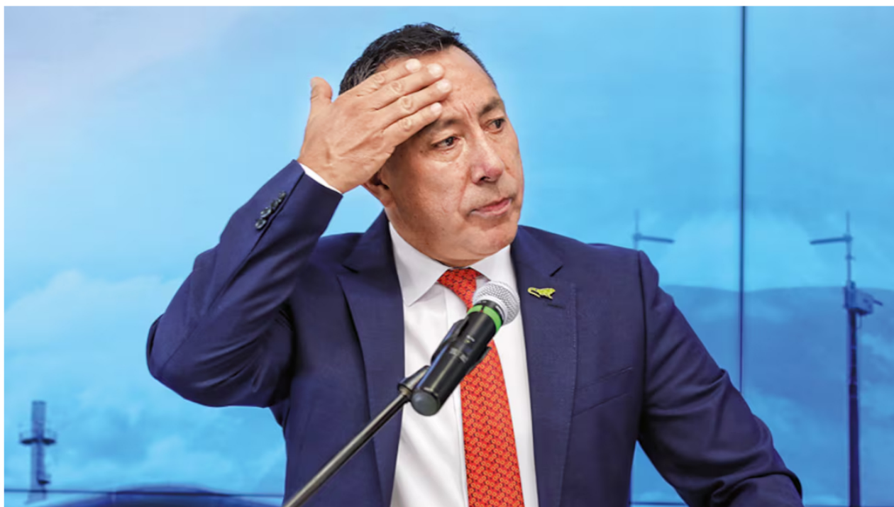
Ricardo Roa, presidente de Ecopetrol , reveló lo que pasará con el gas en Colombia.

El sector energético colombiano ha sufrido una incertidumbre durante los últimos meses, por cuenta de las advertencias de distintas compañías que funcionan en el país y que se encargan de los diferentes negocios. Las propuestas de Gustavo Petro de descarbonizar la economía no han caído muy bien en dichas compañías que, aunque buscan una transición energética, aún dependen del negocio de los hidrocarburos, que es uno de los más contaminantes, pero que también es uno de los que más trae divisas al país.