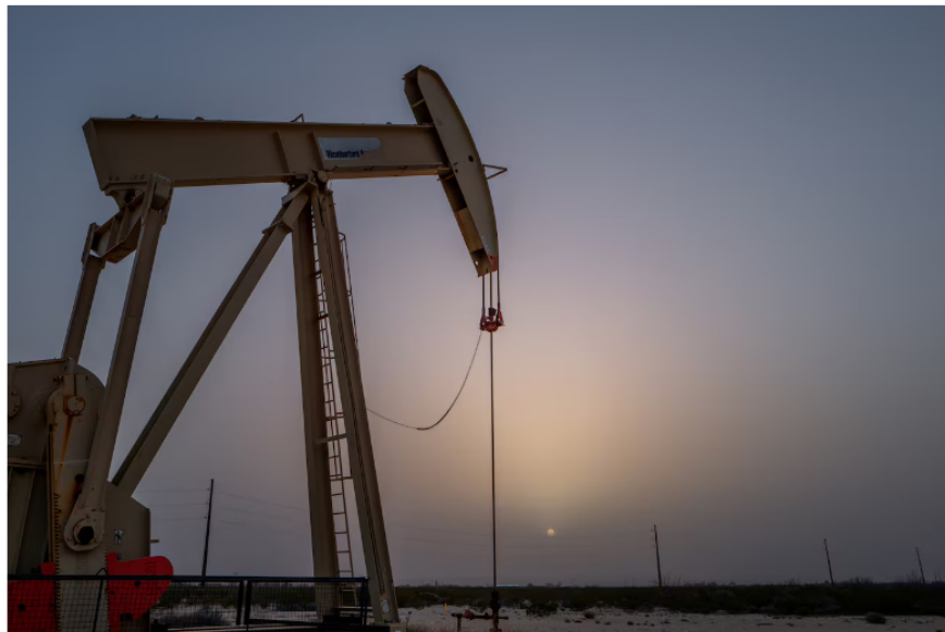
FORT STOCKTON, TEXAS - MARCH 24: The sun sets behind a pumpjack during a gusty night on March 24, 2024 in Fort Stockton, Texas. Employment in Texas has reached record highs, with the oil- and gas-producing Permian Basin, which covers a large swathe of west Texas, leading the way. Permian Basin towns of Midland and Odessa notched 2.6 and 3.5 percent unemployment respectively, according to the report touted earlier this month by Gov. Gregg Abbott.