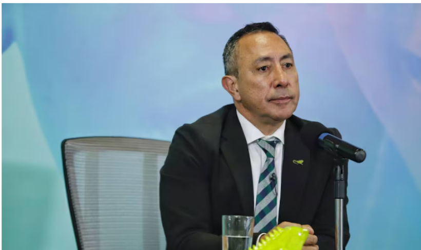
Presidente de Ecopetrol , Ricardo Roa.

La reciente decisión de Ecopetrol de no proceder con la compra de CrownRock, una transacción valorada en US$3.600 millones, ha sido vista por la USO como una oportunidad para fortalecer la exploración y producción interna en Colombia. “Es una oportunidad para reactivar la actividad de exploración dentro del país, generando nuevos puestos de trabajo y aumentando reservas”, afirmó la organización sindical, sugiriendo que los recursos liberados deberían invertirse en la búsqueda de gas natural y el desarrollo de nuevos gasoductos. Le puede interesar: Inversiones