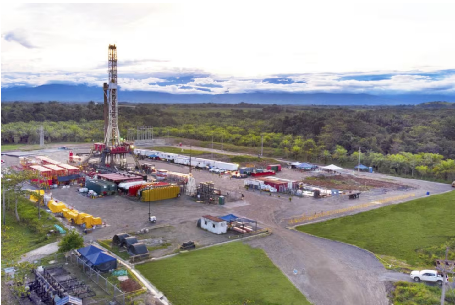
Campo de exploración petrolera en el suroriente de Colombia.

El sindicato de trabajadores de la industria del petróleo insistió en la importancia de redirigir los recursos hacia la exploración y producción en Colombia.