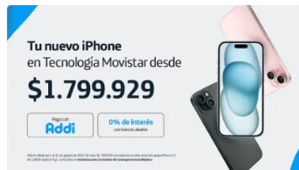
Tu nuevo iPhone en Tecnología Movistar [Oferta Limitada] Tecnología Movistar | Patrocinado