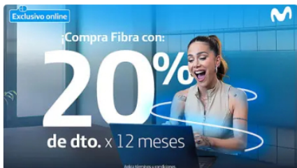
No te quedes sin recibir el 20% en tu nuevo plan de Fibra Movistar Fibra Movistar | Patrocinado