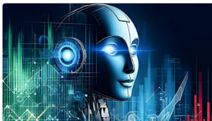
Aprende a invertir con inteligencia artificial como un profesional TEUG | Patrocinado