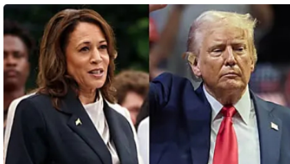
Estados Unidos: Kamala Harris arremete contra Donald Trump: El Heraldo