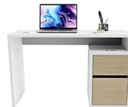
Escritorio Practimac Chiara Blanco-rovere Con El Escritorio Chiara Blanco-rovere Añade Un Toque De Elegancia a Tus Espacios. Este Mueble Listo Para Armar, ... Alkosto | Patrocinado