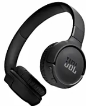
Audífonos de Diadema JBL Inalámbricos Bluetooth On Ear T520BT Negro Los auriculares JBL Tune 520BT Negros transmiten un potente sonido JBL Pure Bass gracias a la última tecnología... ktronixco | Patrocinado