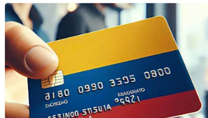
Una inversión en Ecopetrol CFDs podría darte un salario extra TradeLG | Patrocinado