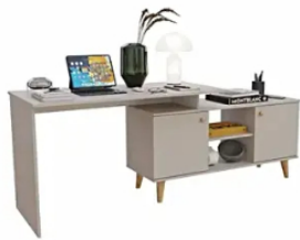
Estación de Trabajo Maderkit Alaska Capri La Estación De Trabajo Maderkit Alaska Tiene Tonalidades Claras Que Le Brindarán Calidez y Armonía a Los Espacios... Alkosto | Patrocinado