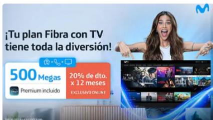
Transforma tu hogar con Fibra Movistar y disfruta Disney+ Fibra Movistar | Patrocinado