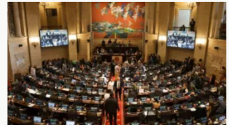
Radican en la Cámara de Representantes proyecto de ley para eliminar el 4x1000