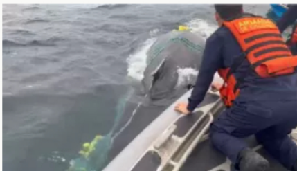
Armada colombiana y comunidad liberan ballena atrapada en malla en el Chocó