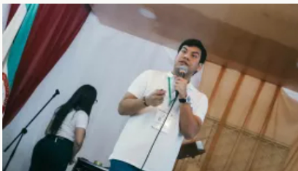
Falleció el alcalde de Aguachica, Cesar, Víctor Roqueme