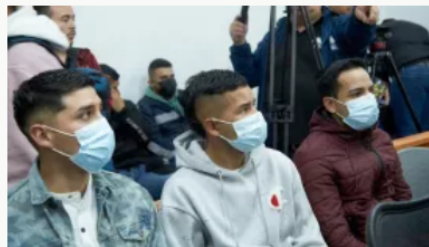
Imputados motociclistas que causaron la muerte a dos mujeres en Soacha