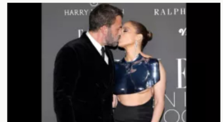
Jennifer López le pide el divorcio a Ben Affleck tras dos años de matrimonio