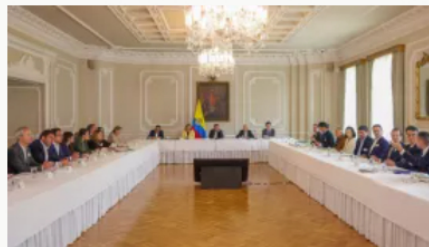
Inversión forzosa: Gobierno y banca cerrarán acuerdo la próxima semana