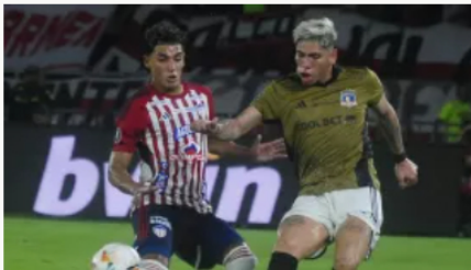
Junior eliminado de la Copa Libertadores tras caer ante Colo Colo