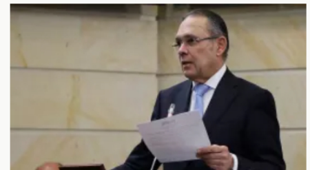
Presidente del Congreso denuncia parálisis en el Senado por falta de recursos