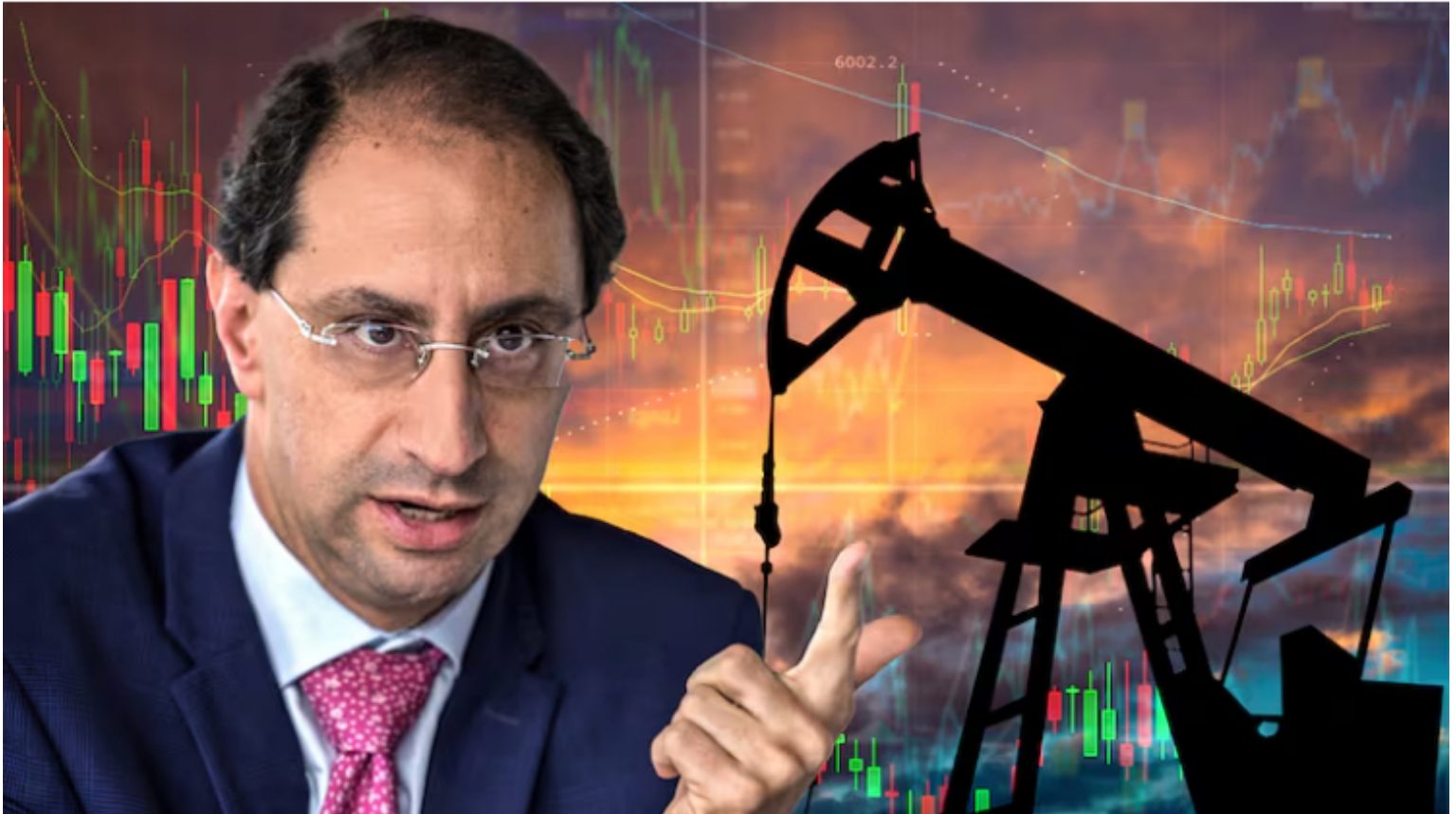
José Manuel Restrepo, exministro y rector de la Universidad EIA.