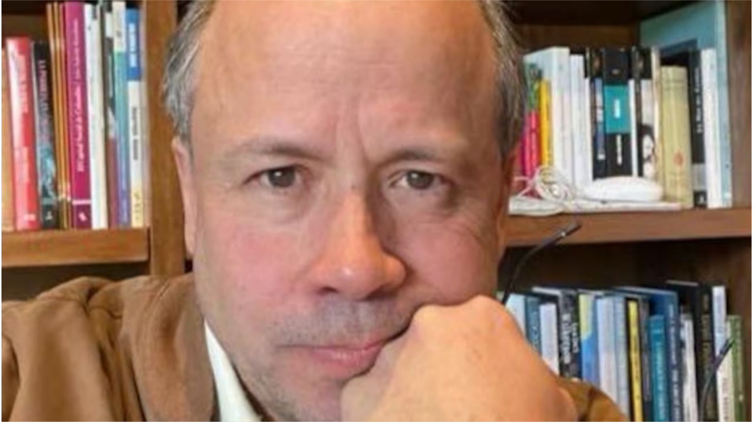
Francisco José Lloreda Mera. Columnista