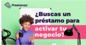
Créditos Sobre Hipoteca