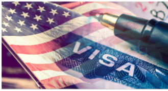
Expertos en Casos EB-2 NIW