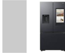
Nevecón SAMSUNG Family Hub Tipo Europeo 845 Litros RF32CG5910B1 con View Inside