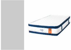
Colchón Romance Relax Sencillo Zafiro New 100 x 190 x 24 cm