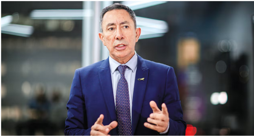
Ricardo Roa, presidente de Ecopetrol . | Foto: esteban vega la-rotta-semana

Colombia, sino de la operación de Ecopetrol en la cuenca del Permian, Estados Unidos , en alianza con la Oxy desde 2019, pues los campos en el país están declinando.