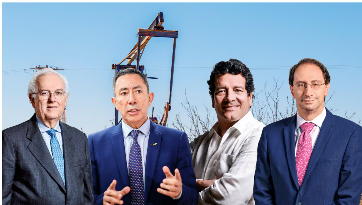
Varios expertos de la economía consideran que no se han tomado buenas decisiones en Ecopetrol .

Las cifras financieras de Ecopetrol para el segundo trimestre de 2024 siguieron de capa caída: los ingresos fueron de 32,6 billones de pesos, disminuyendo 4,9 por ciento frente a los mismos meses de 2023, mientras que las utilidades cayeron 17,4 por ciento y el acumulado en el semestre registró una reducción del 24 por ciento.