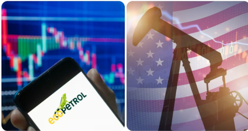
Ecopetrol y fracking en Estados Unidos

R.R.: La junta no ha sesionado en pleno. El comité de inversión que recomendó llevar a la junta es un poco menor de composición y demás, pero siempre en todos los análisis que se hicieron al interior de la junta hubo puntos de vista de todos. Tenemos ambientalistas, una psicóloga especialista en el tema social y relaciones, economistas e ingenieros. Había todos puntos de vista, pero nunca fueron desconocidos los buenos números del proyecto, eso nunca se cuestionó. Aquí quedamos expuestos, fue justamente a una condición que no estaba en nuestras manos definir y era la posibilidad de ir al endeudamiento. Si no hubiéramos visto los atributos del proyecto, seguramente no habría llegado hasta la última instancia, que es la decisión de la junta. Hay dos elementos: habíamos podido llegar al límite de deuda Ebitda de 2,5% y eso fue una advertencia que hizo una de las calificadoras de riesgo y pondría a la compañía digamos en un riesgo de estar perdiendo el grado de inversión. Y el otro era justamente la necesidad de acudir a esa aprobación de Hacienda, que de no tenerla y habiendo ya comprometido la decisión del proyecto, habíamos tenido que incurrir en la penalidad.