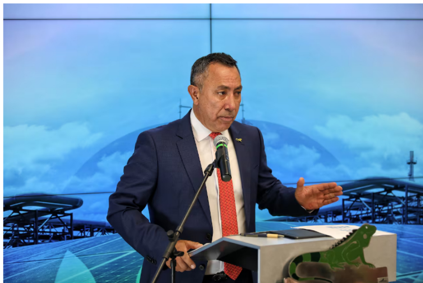
El presidente de Ecopetrol se refirió a la situación de la empresa.

R.R.: No puedo dar mucha información porque hasta eso le cobró la Superfinanciera a alguien que salió a dar el anuncio. Pero se tomó la decisión de nombrar una persona presidente de ISA. Fue una votación bastante reñida, eso sí puedo decirlo, pero los detalles, habrá que esperar. Estamos en una fase en la que hay que hacer la oferta laboral al candidato, mirar sus condiciones y también hacer unas validaciones, como ya lo dijo un comunicado, sobre temas de que no tenga incompatibilidades o inhabilidades para poder ser el presidente de ISA.