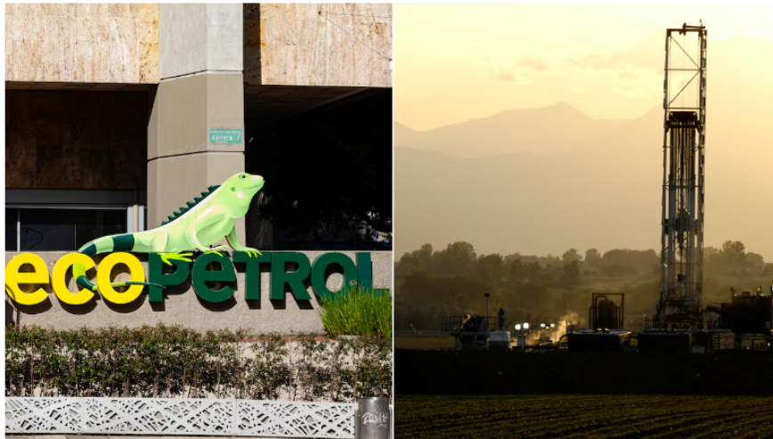
Ecopetrol y fracking

Eso le diría a él y a todos los críticos que dicen que estamos destruyendo. Ya mencioné las cifras de cuál es la generación de riqueza y de valor que estamos entregando desde Ecopetrol a la nación. Sí hay una situación muy compleja que heredamos, y es la acumulación de saldos del Fondo de Estabilización de Precios de los Combustibles que nos dejó el gobierno anterior en una suma cercana en los últimos tres años a 80 billones de pesos, son cuatro reformas tributarias, y el gobierno ha venido honrando ese pago de esos saldos del FEPEC generándole otra vez a Ecopetrol la liquidez y la posibilidad de acometer sus inversiones y su operación con tranquilidad.