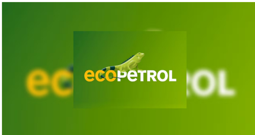
La iguana, logo oficial de Ecopetrol

R.R.: El otro tema es la actividad exploratoria. Son 600 millones de dólares este año que tenemos pensado invertir. Ya vamos en 200, en prácticamente 10 pozos que queremos perforar. Vamos en 4 y en el resto del año vamos a perforar 6 más para alcanzar esa meta de casi 600 millones de dólares que tenemos dentro del plan de inversiones. Mostrando que seguimos produciendo y buscando más petróleo y gas.