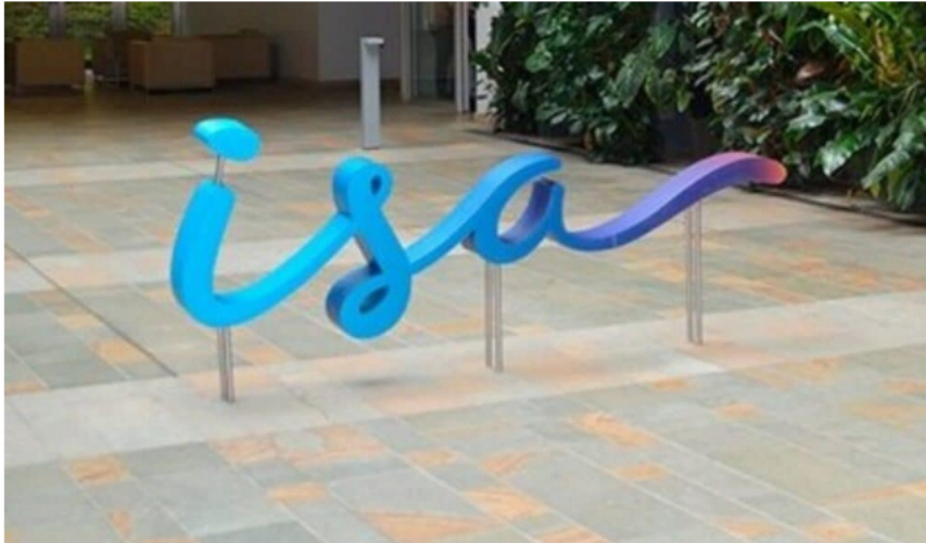
Resultados de ISA.