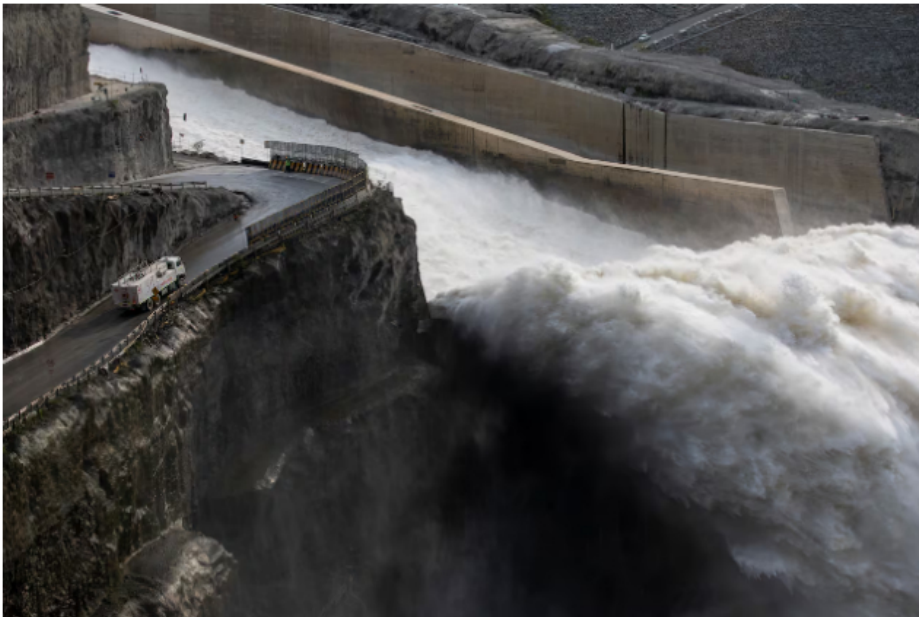
HIDROITUANGO 4 DE ABRIL 2019