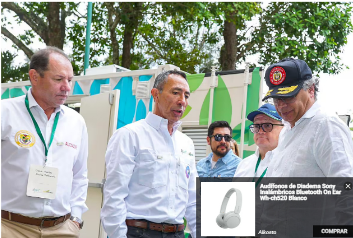
A principios de este mes, se conoció que la Junta Directiva de Ecopetrol rechazó adquirir la participación sobre los activos de la sociedad CrownRock de propiedad de Occidental Petroleum, OXY.