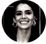
María Fernanda Carrascal Representante a la Cámara

LABORAL. CON 81 ARTÍCULOS APROBADOS Y 23 HUNDIDOS EN LA COMISIÓN SÉPTIMA, EL PROYECTO BUSCA SUPERAR ESA DISCUSIÓN PARA CONTINUAR EL TRÁMITE EN EL SENADO