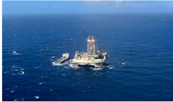
Uchuva-2 de Ecopetrol y Petrobras promete buenos resultados, pero falta viabilidad comercial del gas.

Ecopetrol y Petrobras están entusiasmados con los resultados que han entregado Uchuva-1 - que permitió uno de los descubrimientos de gas natural más grandes en Colombia en los últimos años- y Uchuva-2 que ayudó a delimitar el hallazgo; pero, pese a estos avances, los expertos del sector aún no cantan victoria.