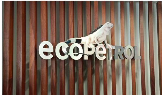
Ecopetrol tuvo un decrecimiento en sus ganancias en el primer semestre de 2024.

La petrolera estatal colombiana Ecopetrol reportó sus estados financieros y operativos al corte del segundo trimestre y del primer semestre de 2024.