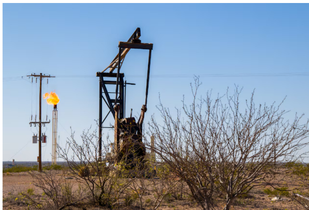
El Permian es una de las cuencas más atractivas para la producción de hidrocarburos hoy en el mundo.

La operación le hubiera permitido, según los mismos cálculos de Ecopetrol, aumentar su producción, crecer en sus reservas e incrementar en sus cuentas financieras el ebitda y las utilidades netas. Además, sería una operación ambientalmente más limpia que los campos que maneja Ecopetrol en Colombia.