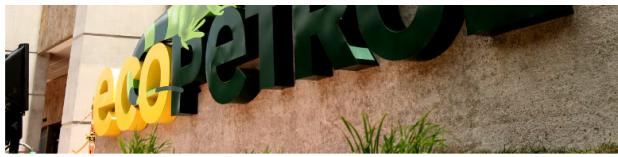
El negocio con la compra del 30% de CrownRock le hubiera permitido a la compañía aumentar sus reservas, crecer su producción e incrementar su ebitda y su utilidad neta.

A su vez, sin el desarrollo de este nuevo proyecto se estiman reservas probadas (1P) por 1.743 millones de barriles equivalentes y un índice de reposición de 42% a 43%. "Con Oslo, esa cifra se incrementaría en 212 millones de barriles. El índice de reposición de reservas se ubicaría en 126% a 129%", advierte el informe interno. Esto significa que, con la adquisición, las reservas 1P con corte a diciembre de 2024 tendrían un aumento de 9%.