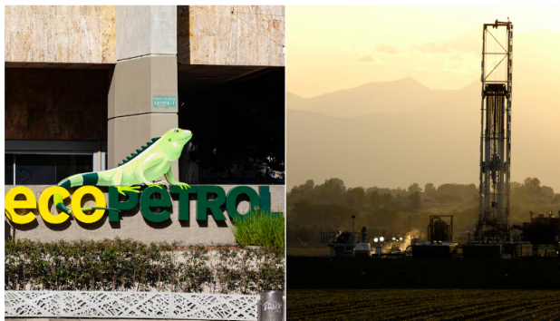
Aunque hay una fuerte crítica ambiental contra el fracking, un informe interno de Ecopetrol muestra que la emisión de CO2 es mucho menor en la operación de Estados Unidos, que en los campos que tiene en Colombia.

Además, la utilidad neta, para 2025 se estima entre 9 y 12 billones de pesos, con un precio del Brent también en un rango entre 73 y 79 dólares por barril. Oslo impulsaría la utilidad neta entre 1,3 y 1,6 billones de pesos adicionales, esto representa un incremento de 14%.