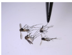
VIRUS DEL NILO OCCIDENTAL: 69 INFECTADOS Y 8