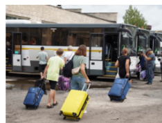
EVACUACIÓN EN CURSO EN DISTRITO RUSO DE