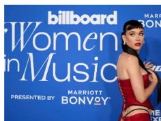
GOBIERNO BALEAR INVESTIGA POSIBLE