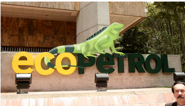
Ecopetrol presentó su segundo informe de ganancias y estados financieros. Así se comportó en el segundo trimestre de 2024.

13 de agosto de 2024 Por: Redacción Economía