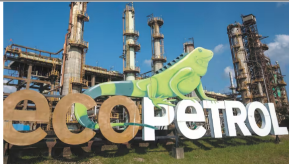
Foto de referencia.

Te puede interesar Enlaces Patrocinados por Taboola