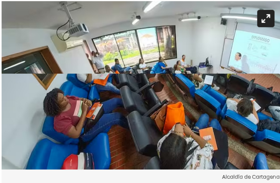
Alcaldía de Cartagena

La formación es por una alianza entre el EPA Cartagena y Ecopetrol