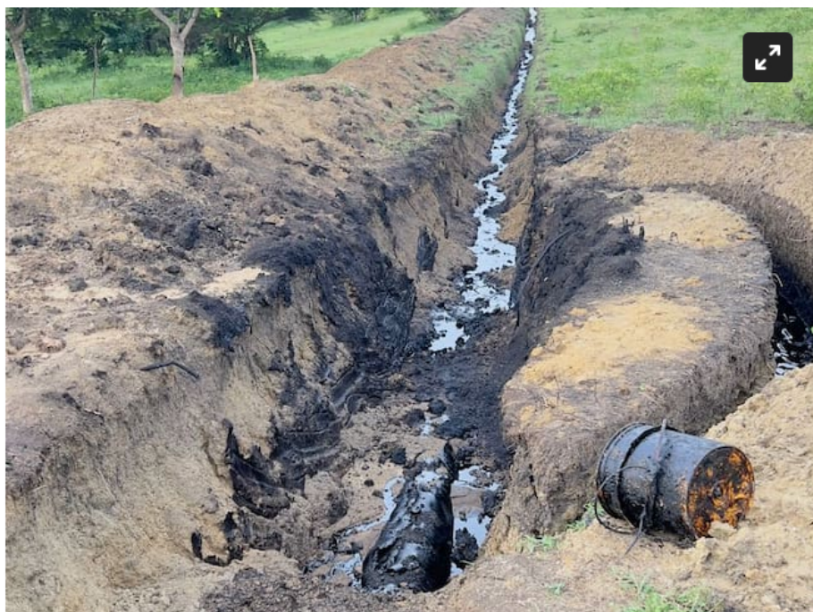
Inescrupulosos rompieron el oleoducto Caño Limón- Coveñas en Betulia, Sucre

Según campesinos varios hombres se hicieron pasar por funcionarios de Ecopetrol , al parecer, para robar combustible y provocando derrame de crudo.