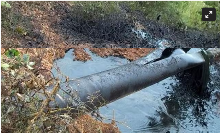
Oleoducto Caño Limón .

Cenit, filial de Ecopetrol , controla la emergencia en Betulia, Sucre al tiempo que culmina la recolección del crudo derramado por daño de terceros.