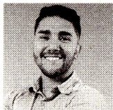
CRISTIAN MORENO Enviado especial

Durante la rueda de prensa conjunta con el canciller Luis Murillo , el Ministro de las TIC, manifestó que se espera el aval del presidente Gustavo Petro para una propuesta que busca que las empresas que inviertan en IA puedan tener una reducción de impuestos o una tarifa preferencial.