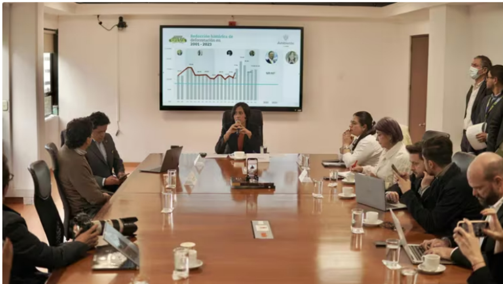
La ministra Susana Muhamad envía al Legislativo un proyecto de ley para prohibir el fracking

Según el texto presentado por el Ministerio de Ambiente y que sería estudiado nuevamente por el Senado tras ser archivado en junio del año en curso, el proyecto de ley aboga por la prohibición de la exploración y explotación de hidrocarburos provenientes de yacimientos no convencionales (YNC).