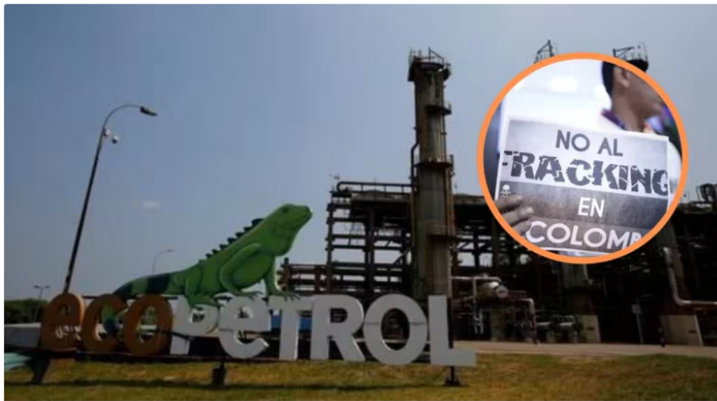
Ecopetrol desistió de comprar la empresa minera CrownRock por veto de Gustavo Petro

El Gobierno Nacional, encabezado por el presidente Gustavo Petro, sigue firme en su postura de prohibir el fracking , a pesar de la crisis que atraviesa el sector de los hidrocarburos en el país.