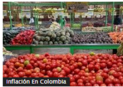
Inflación En Colombia

Frontera Energy redujo su pérdida neta y elevó producción en segundo trimestre