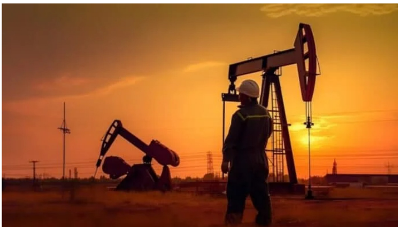
¿Cuáles son las tendencias del sector de petróleo y gas en América Latina?