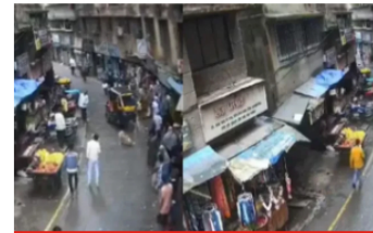
Niña de 4 años murió cuando le cayó encima un golden retriever que saltó de un edificio en la India