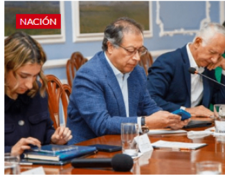
¿Por qué Petro no defiende el constituyente venezolano?