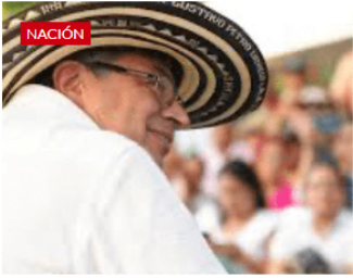
Al oído y en voz baja... ¿Cómo fue la amenaza de Petro sobre Ecopetrol ?