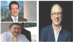
La dura respuesta de expresidentes de Ecopetrol al presidente Petro 14 mayo, 2024 En «Nación»