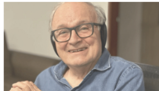
Crónica #844 del maestro Gardeazábal: los espantapájaros de Ecopetrol 18 marzo, 2024 En «Opinión»