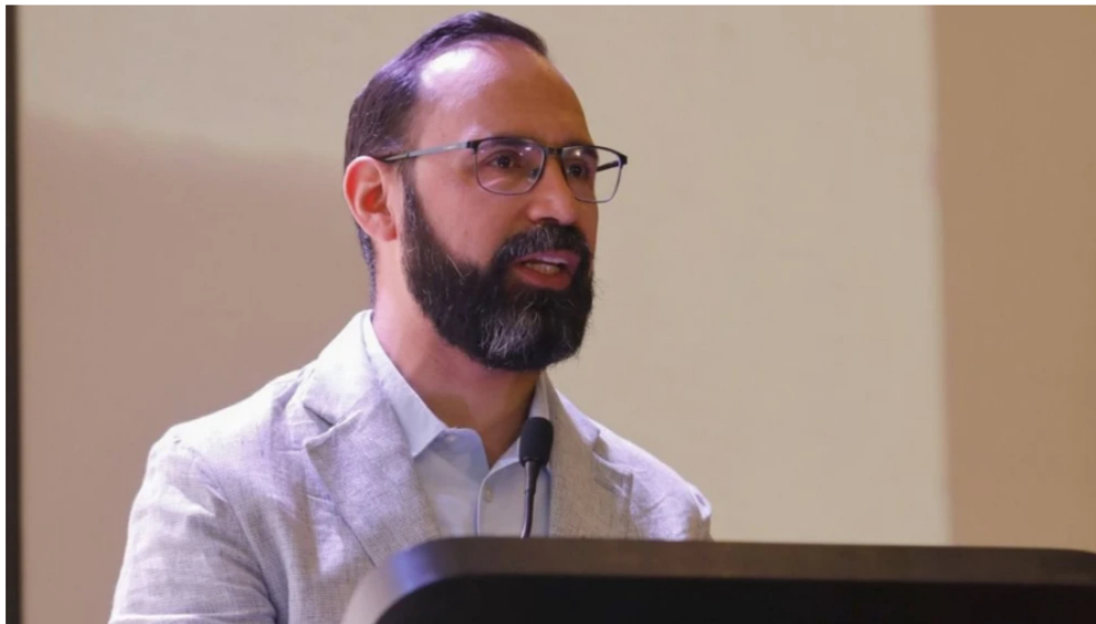
Ministro de Minas y Energía Andrés Camacho

Tras dos años de impulso al proyecto, el Gobierno nacional desiste de la importación de gas desde Venezuela y asegura que no habrá problemas de suministro.