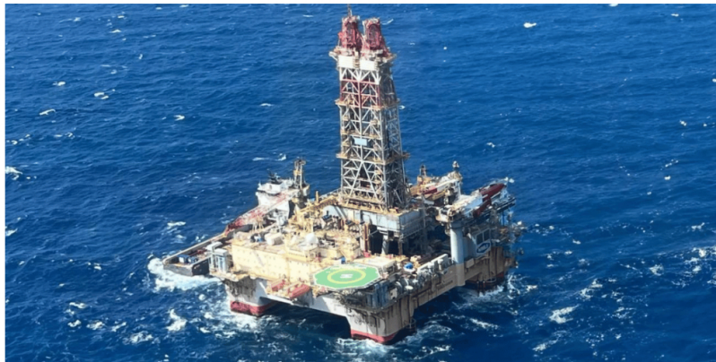
ECOPETROL CONFIRMA NUEVO DESCUBRIMIENTO DE GAS EN LAS COSTAS DE SANTA MARTA