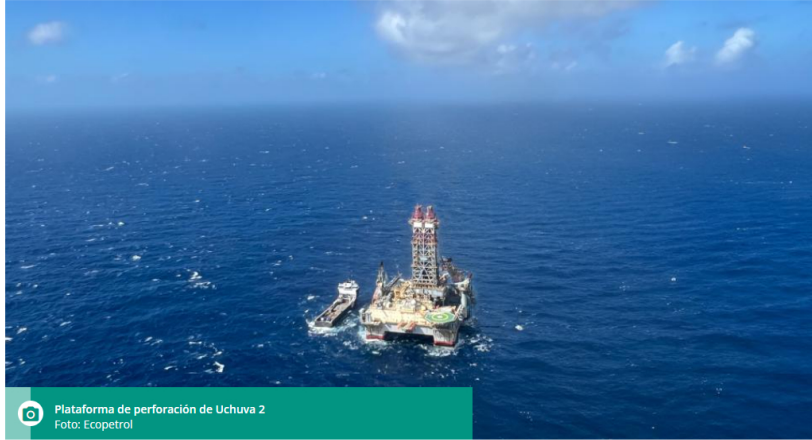
Plataforma de perforación de Uchuva 2

La perforación continúa y se espera confirmar por medio de pruebas de laboratorio.