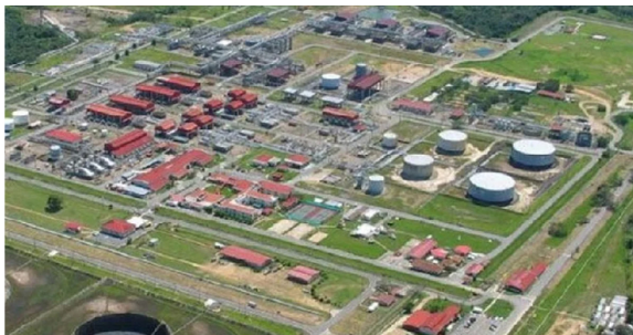
El campo de Cusiana fue descubierto por British Petroleum

Durante muchos años Colombia vivió del gas de La Guajira, pero este representa ahora solo el 10% mientras los grandes yacimientos desde comienzos de los años 90, están en Casanare. El descubrimiento en 1989 del yacimiento de Cusiana (Casanare), que formaba parte del Contrato Santiago de las Atalayas, suscrito entre Ecopetrol, British Petroleum, Total y Tintón, con reservas de 750 Mbbls, cambió la ecuación de la producción de gas en Colombia. A este gran yacimiento se le sumó en 1993, el de Cupiagua en el piedemonte llanero, Casanare, con reservas de 510 Mbbls.