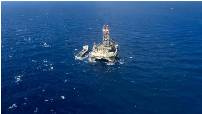
El pozo, situado a 31 kilómetros de la costa y con una profundidad de 804 metros, subraya la capacidad técnica de Ecopetrol para realizar proyectos complejos en aguas profundas

Petrobras, como parte del consorcio, tiene un papel crucial en esta exploración. La compañía brasileña actúa como operadora y posee una amplia experiencia en manejo y explotación de reservas de gas y petróleo en áreas marítimas. La colaboración entre Ecopetrol y Petrobras se ha destacado por su efectividad, logrando avances significativos en el desarrollo de esta nueva fuente de energía.