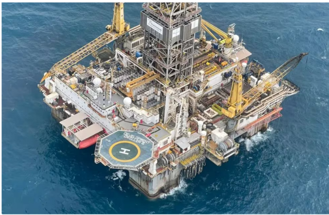
El trabajo conjunto de las empresas brasileña y colombiana en el Bloque Tayrona da frutos con el descubrimiento de un prometedor yacimiento de gas natural en el Caribe colombiano

"Ecopetrol viene intensificando su trabajo para consolidar un portafolio robusto de proyectos costa afuera, con el fin de contar con una nueva oferta de gas natural que responda a las expectativas de la seguridad y la transición energética en el país", afirmó la compañía en su comunicado.