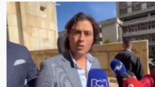
Suspensión y reprogramación de la audiencia contra Nicolás Petro