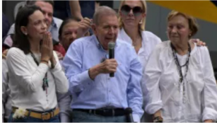
Edmundo González se autoproclama presidente electo de Venezuela