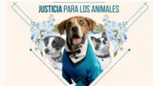
En libertad depravado que abusó sexualmente de una perrita en Florencia, Caquetá