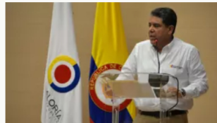
Admiten nueva demanda contra la elección del contralor general, Carlos Hernán Rodríguez