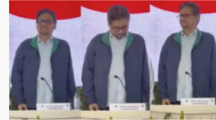
Iván Márquez felicita a Nicolás Maduro por su "gran triunfo popular"