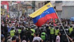
Líderes de Europa exigen transparencia y respeto a los derechos en Venezuela