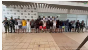
Extorsión sin tregua en Colombia: 143 capturas y 12 organizaciones criminales y nuevas modalidades