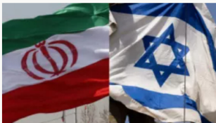
Escalada militar en Medio Oriente: Irán y Hezbolá prometen respuesta a Israel