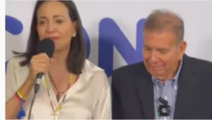
Exigen la inmediata proclamación de Edmundo González como el presidente electo en Venezuela