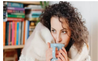
IDEAM explicó por qué ha hecho tanto frío en Bogotá