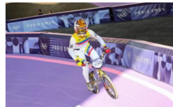
Mariana Pajón rompió en llanto al quedar eliminada: conmovedor momento