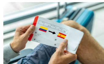
Emigrar a España desde Colombia: