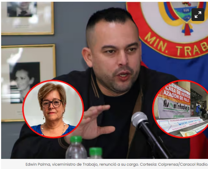
Edwin Palma, viceministro de Trabajo, renunció a su cargo.