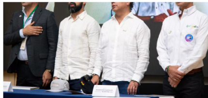
De izquierda a derecha, el gobernador de Santander, Juvenal Díaz; el ministro de Minas y Energía, Andrés Camacho; el presidente Gustavo Petro; y el presidente de Ecopetrol, Ricardo Roa, en el lanzamiento del Instituto Colombiano del Petróleo y las Energías de la Transición, Icpet, en Piedecuesta.

Lea también: Ecopetrol transformó el ICP y ahora será la 'punta' de la transición energética