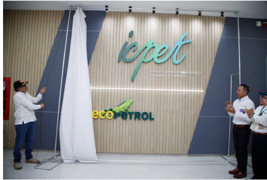
El presidente Gustavo Petro reveló el logo del Instituto Colombiano del Petróleo y las Energías de la Transición, Icpet, ubicado en Piedecuesta.

Con la presencia del presidente Gustavo Petro fue presentado el Instituto Colombiano del Petróleo y Energías de la Transición, Icpet, que será fundamental para los cambios en la matriz energética del país. Se invertirán 280 millones de dólares en un lapso de tres años.