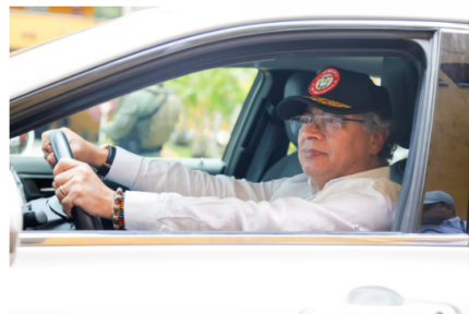
El presidente Gustavo Petro estuvo en Santander para el lanzamiento del Instituto Colombiano del Petróleo y las Energías de la Transición, Icpet, con sede en Piedecuesta.

Sobre el valor que aportaría el Icpet para la economía nacional, el presidente de Ecopetrol planteó que éste aportaría entre $20 y $25 billones, producto de toda la explotación comercial económica.