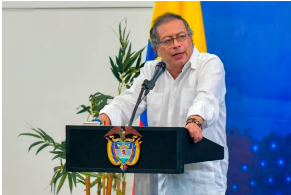
El presidente de Colombia Gustavo Petro visitará a Bucaramanga este 31 de julio.