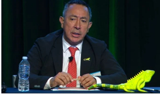
Ricardo Roa, presidente de Ecopetrol. Roa.

El presidente de Ecopetrol, Ricardo Roa Barragán, entregó más detalles de lo que viene para Colombia en medio de la coyuntura de déficit de gas natural: entre las novedades, el ejecutivo mencionó que el país ya tiene ocho propuestas para poder importar el energético.